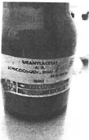
obr. č. 4