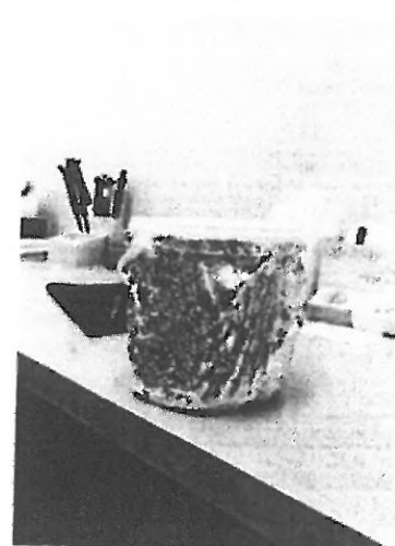
obr. č. 6