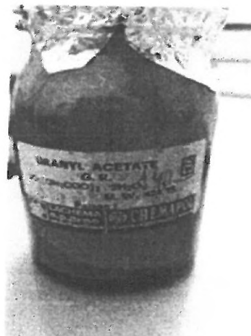
obr. č. 5