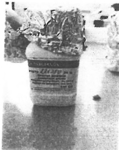
obr. č. 2